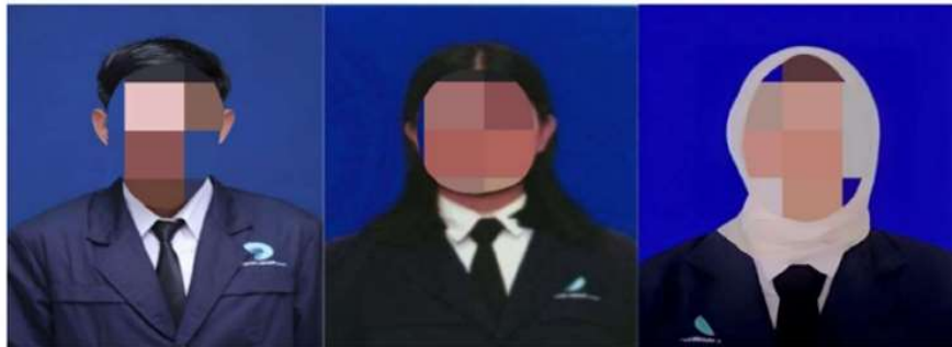
Contoh Pas Foto Laki-Laki