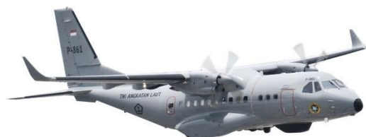
Gbr. 2 Contoh gambar dengan resolusi cukup