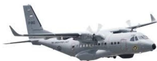
Gbr. 1 Contoh gambar dengan resolusi kurang