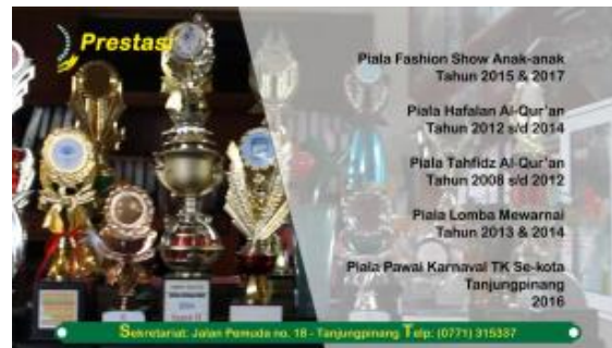
Gambar 1 Screen Shot

(Times New Roman, 10, rata tengah, cetak tebal)