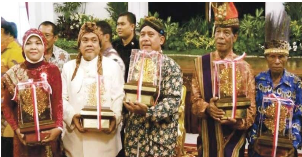
Gambar VI.6: Penerima penghargaan Kalpataru sebagai bentuk apresiasi pemerintah terhadap pemerhati lingkungan.

Kelima , kerusakan lingkungan yang berdampak terhadap berbagai aspek kehidupan manusia, seperti kesehatan, kelancaran penerbangan, nasib generasi yang akan datang, global warming , perubahan cuaca, dan lain sebagainya. Kasus-kasus tersebut menunjukkan bahwa kesadaran terhadap nilai-nilai Pancasila sebagai sistem etika belum mendapat tempat yang tepat di hati masyarakat. Masyarakat Indonesia dewasa ini cenderung memutuskan tindakan berdasarkan sikap emosional, mau menang sendiri, keuntungan sesaat, tanpa memikirkan dampak yang ditimbulkan dari perbuatannya. Contoh yang paling jelas adalah pembakaran hutan di Riau sehingga menimbulkan kabut asap. Oleh karena itu, Pancasila sebagai sistem etika perlu diterapkan ke dalam peraturan perundang-undangan yang menindak tegas para pelaku pembakaran hutan, baik pribadi maupun perusahaan yang terlibat. Selain itu, penggiat lingkungan dalam kehidupan bermasyarakat, berbangsa, dan bernegara juga perlu mendapat penghargaan seperti gambar berikut.