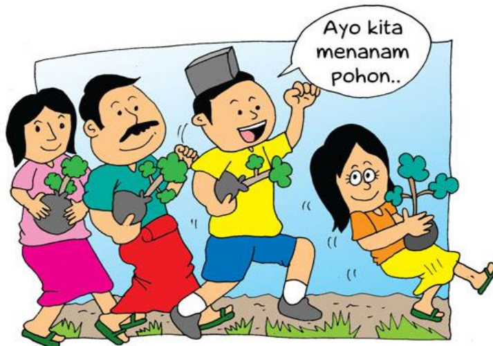
Gambar VI.7: Menanam pohon sebagai bentuk kesadaran atas lingkungan hidup yang asri.

Lingkungan hidup yang nyaman melahirkan generasi muda yang sehat dan bersih sehingga kehidupan bermasyarakat, berbangsa, dan bernegara menjadi lebih bermakna sebagaimana tercermin dalam gambar berikut.