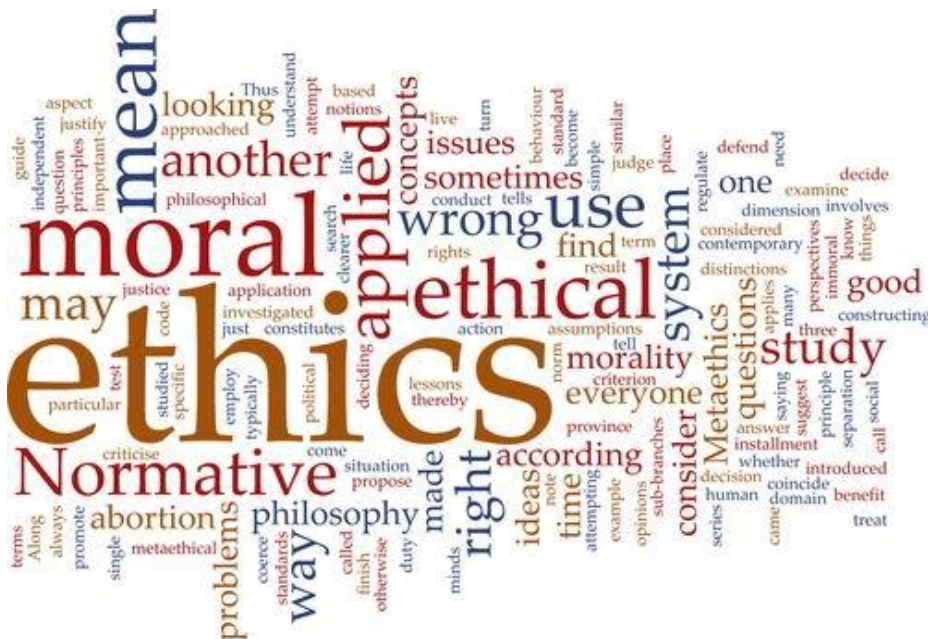
Gambar VI.0 Etika merupakan struktur pemikiran yang disusun untuk memberikan tuntunan atau panduan dalam bersikap dan bertindak laku

Pancasila sebagai sistem etika di samping merupakan way of life bangsa Indonesia, juga merupakan struktur pemikiran yang disusun untuk memberikan tuntunan atau panduan kepada setiap warga negara Indonesia dalam bersikap dan bertindak laku. Pancasila sebagai sistem etika, dimaksudkan untuk mengembangkan dimensi moralitas dalam diri setiap individu sehingga memiliki kemampuan menampilkan sikap spiritualitas dalam kehidupan bermasyarakat, berbangsa, dan bernegara. Mahasiswa sebagai peserta didik termasuk anggota masyarakat ilmiah-akademik yang memerlukan sistem etika yang orisinal dan komprehensif agar dapat