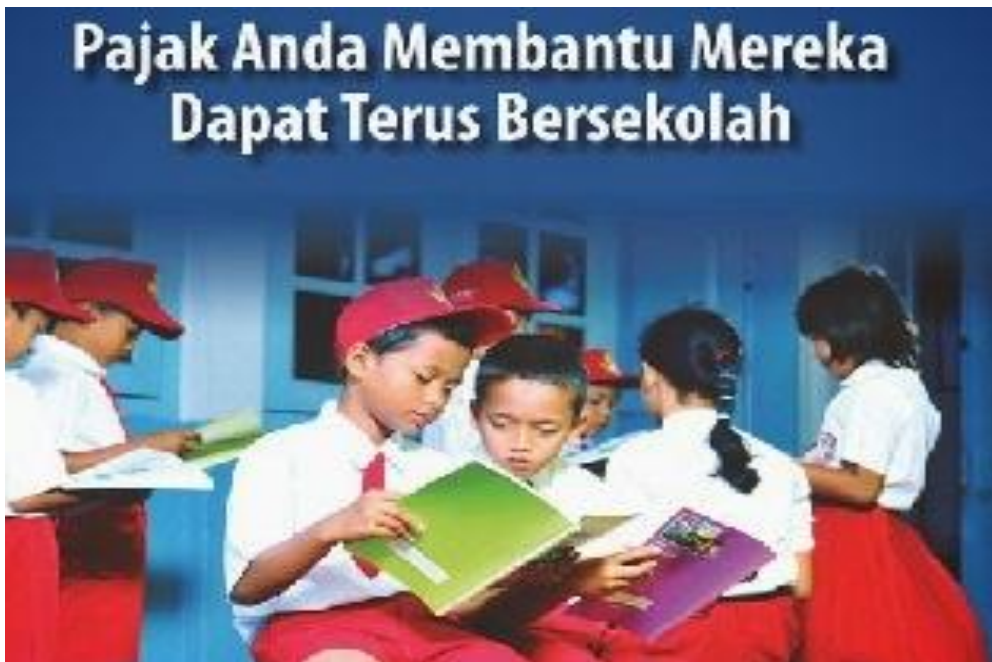
Gambar VI.5: Pajak yang telah dibayar oleh masyarakat salah satunya digunakan untuk membiayai pendidikan di Indonesia, membangun gedung sekolah, mendanai Bantuan Operasional Sekolah, maupun untuk membeli buku-buku pelajaran agar jutaan anak Indonesia dapat terus bersekolah.

Ketiga , kurangnya rasa perlu berkontribusi dalam pembangunan melalui pembayaran pajak. Hal tersebut terlihat dari kepatuhan pajak yang masih rendah, padahal peranan pajak dari tahun ke tahun semakin meningkat dalam membiayai APBN. Pancasila sebagai sistem etika akan dapat mengarahkan wajib pajak untuk secara sadar memenuhi kewajiban perpajakannya dengan baik. Dengan kesadaran pajak yang tinggi maka program pembangunan yang tertuang dalam APBN akan dapat dijalankan dengan sumber penerimaan dari sektor perpajakan. Berikut ini diperlihatkan gambar tentang iklan layanan masyarakat tentang pendidikan yang dibiayai dengan pajak.