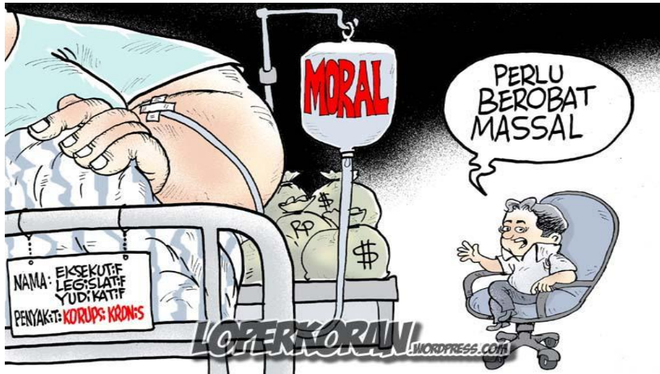
Gambar VI.3: Korupsi merupakan penyakit moral yang kronis yang perlu disembuhkan.