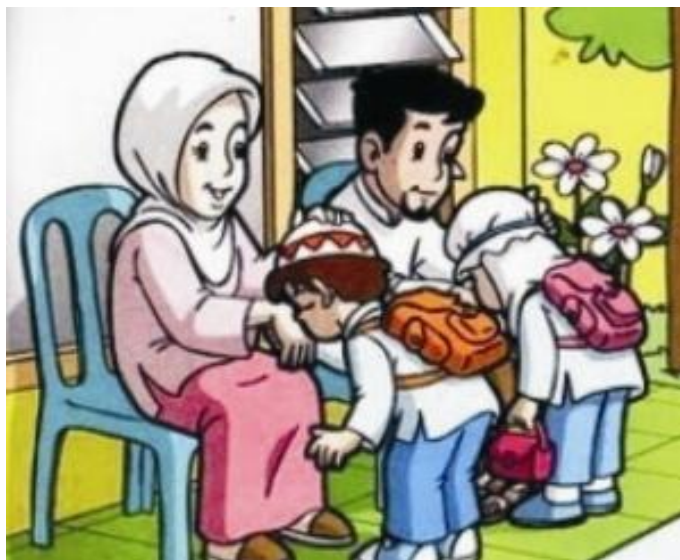
Gambar VI.2: Meminta doa restu orang tua merupakan salah satu etika sebelum berangkat sekolah