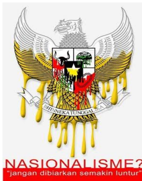
Gambar VI.9: Hilangnya Nasionalisme

"Bahwa moral bangsa semakin hari semakin merosot dan semakin hanyut dalam arus konsumerisme, hedonisme, eksklusivisme, dan ketamakan karena bangsa Indonesia tidak mengembangkan blueprint yang berakar pada sila Ketuhanan Yang Maha Esa".