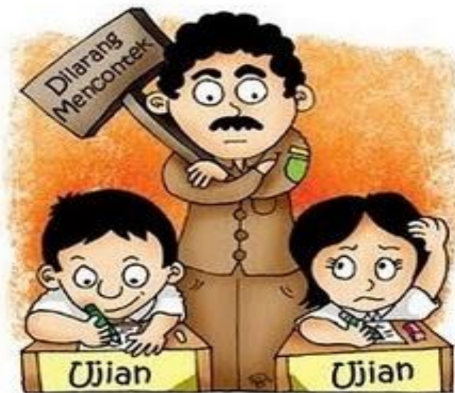
Gambar VI.1: Tidak mencontek merupakan salah satu etika dalam melaksanakan ujian sekolah