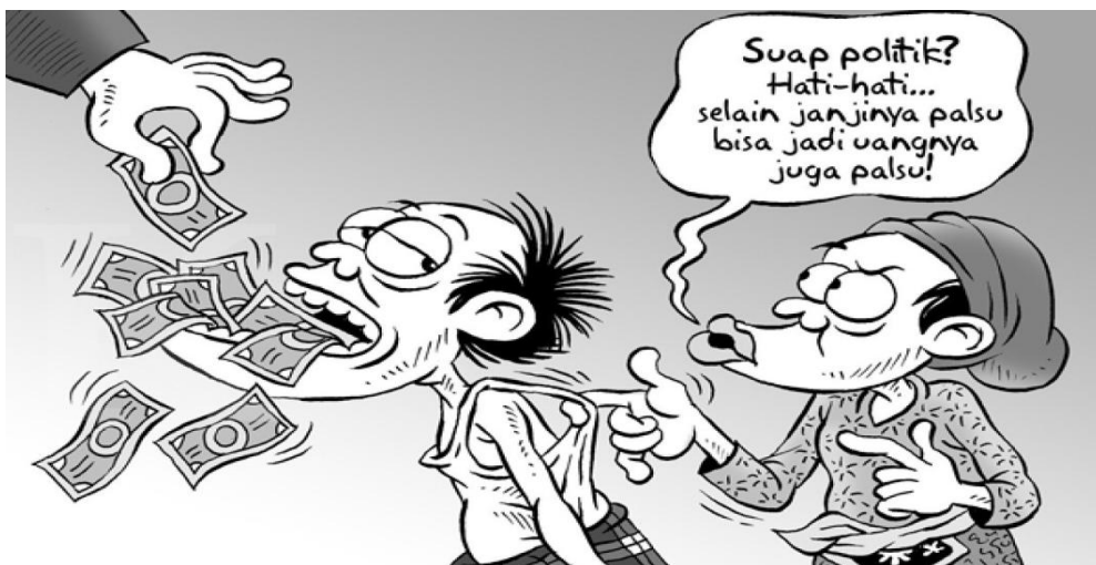
Gambar VI.4: Salah satu etika dalam berdemokrasi adalah menolak berbagai macam bentuk suap dalam proses pemilihan wakil-wakil rakyat.

Etika Pancasila diperlukan dalam kehidupan bermasyarakat, berbangsa, dan bernegara sebab berisikan tuntunan nilai-nilai moral yang hidup. Namun, diperlukan kajian kritis-rasional terhadap nilai-nilai moral yang hidup tersebut agar tidak terjebak ke dalam pandangan yang bersifat mitos. Misalnya, korupsi terjadi lantaran seorang pejabat diberi hadiah oleh seseorang yang memerlukan bantuan atau jasa si pejabat agar urusannya lancar. Si pejabat menerima hadiah tanpa memikirkan alasan orang tersebut memberikan hadiah. Demikian pula halnya dengan masyarakat yang menerima sesuatu dalam konteks politik sehingga dapat dikategorikan sebagai bentuk suap, seperti contoh berikut: