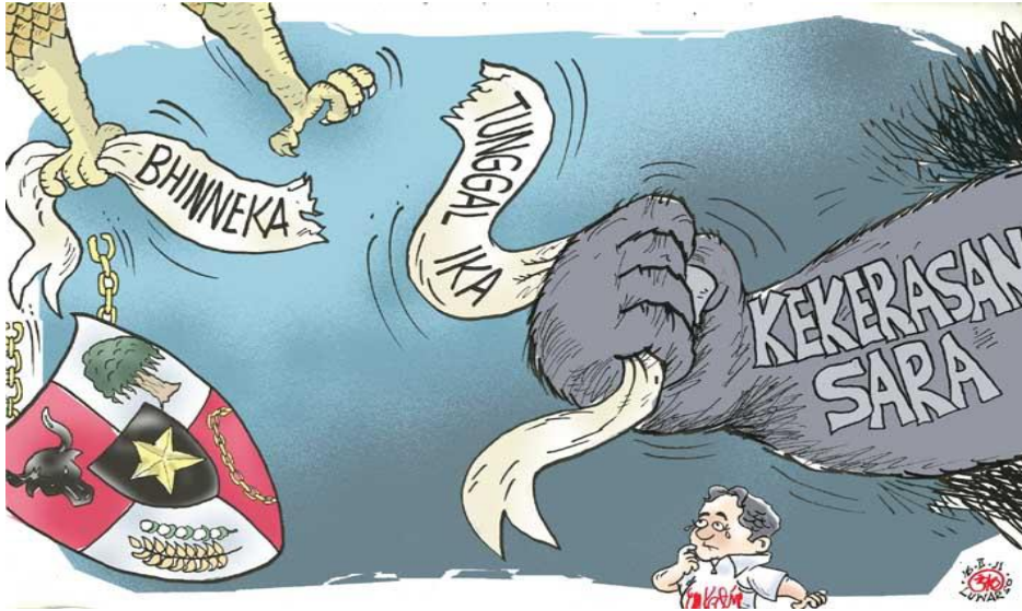
Gambar IV.8: Robeknya Bhineka Tunggal Ika karena kasus terorisme dan kekerasan