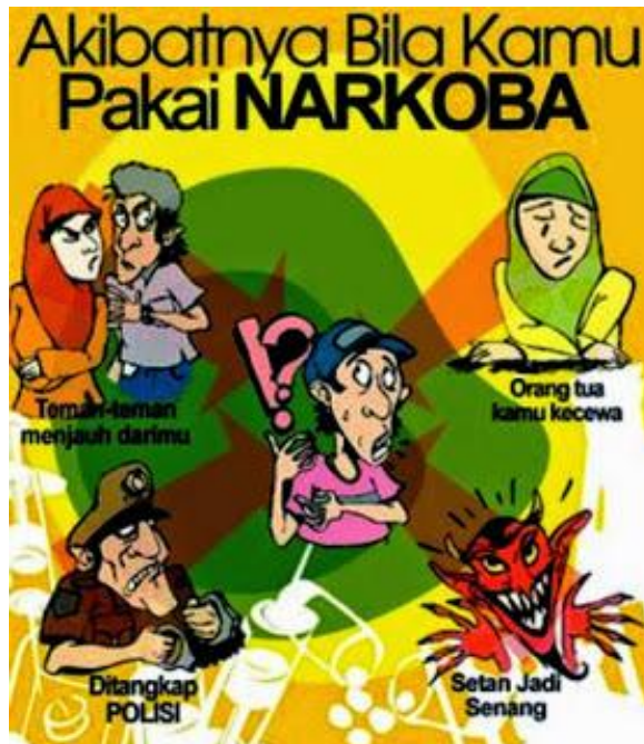
Gambar IV.6: Akibat yang akan dialami oleh generasi muda yang memakai narkoba. Sumber: http://designcartoon.wordpress.com/media-kie/p-o-s-t-e-r-narkoba/