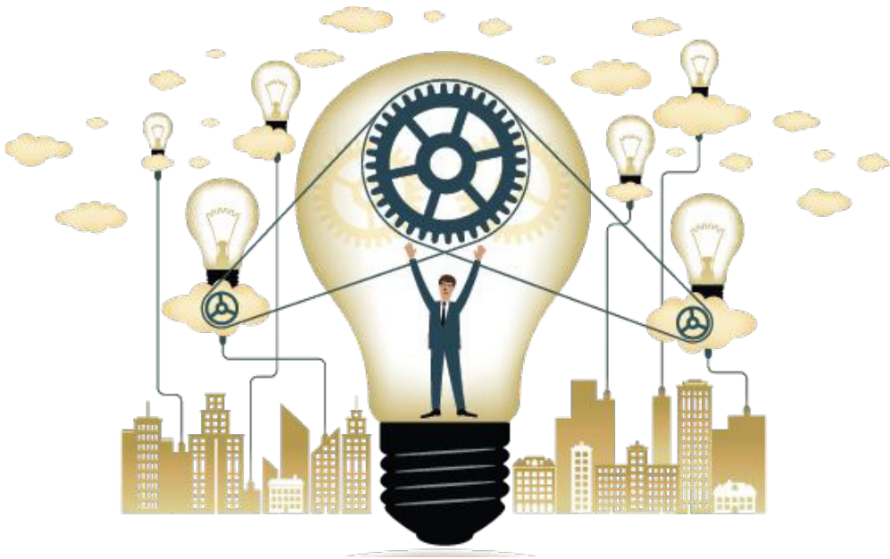
Gambar IV.0 ideologi merupakan seperangkat sistem yang menjadi dasar pemikiran setiap warga negara dalam kehidupan bermasyarakat, berbangsa, dan bernegara.

Pada Bab IV ini Anda akan diajak menelusuri berbagai konsep tentang ideologi negara. Hal ini sangat penting karena ideologi merupakan seperangkat sistem yang diyakini setiap warga negara dalam kehidupan bermasyarakat, berbangsa, dan bernegara. Anda tentu mengetahui bahwa setiap sistem keyakinan itu terbentuk melalui suatu proses yang panjang karena ideologi melibatkan berbagai sumber seperti kebudayaan, agama, dan pemikiran para tokoh . Ideologi yang bersumber dari kebudayaan, artinya berbagai komponen budaya yang meliputi: sistem religi dan upacara keagamaan, sistem dan organisasi kemasyarakatan, sistem pengetahuan, bahasa, kesenian, sistem mata pencaharian hidup, sistem teknologi dan peralatan, sebagaimana