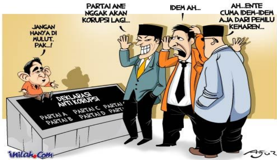
Gambar IV.7: Gambar ketidakpercayaan masyarakat terhadap partai politik.