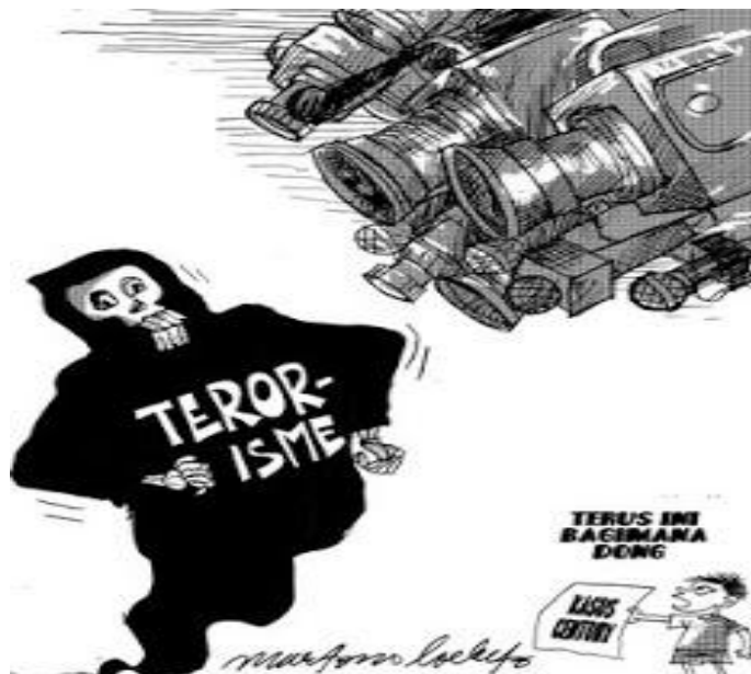
Gambar IV.5: Terorisme merupakan ancaman terhadap keberlangsungan hidup bangsa Indonesia dan ideologi negara.