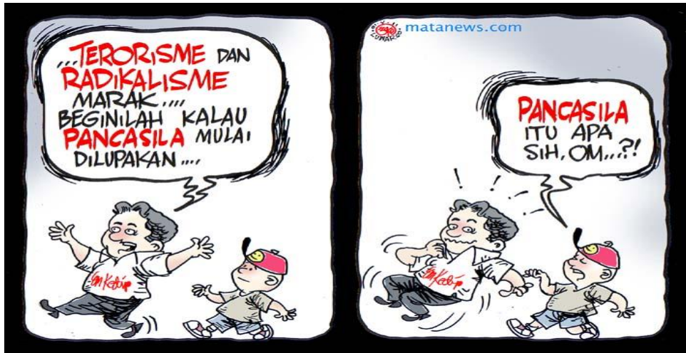
Gambar IV.6: Untuk menanggulangi terorisme dan radikalisme, perlu penguatan nilai-nilai kebangsaan melalui pendidikan Pancasila kepada generasi muda.