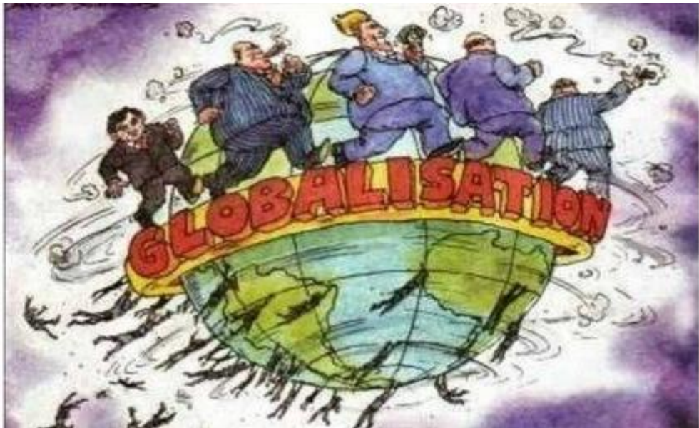
Gambar IV.4: Globalisasi merupakan era saling keterhubungan antara masyarakat suatu bangsa dan masyarakat bangsa yang lain sehingga masyarakat dunia menjadi lebih terbuka.

ideologi Pancasila. Adapun fase-fase perkembangan globalisasi itu adalah sebagai berikut: