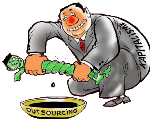
Gambar IV.3: Sejak lahirnya kapitalisme, ada dua kelas yang terus bertarung: buruh dan kapitalis. Kapitalis ingin memberikan upah yang rendah, sementara buruh terus menuntut upah yang lebih baik. Bagaimana pandangan ini menurut Pancasila?

Untuk mengetahui posisi ideologi Pancasila di antara ideologi besar dunia, maka Anda perlu mengenal beberapa jenis ideologi dunia sebagai berikut.