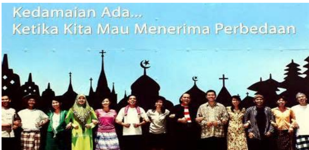
Gambar II.5: Toleransi Umat Beragama

Nilai-nilai Pancasila (ketuhanan, kemanusiaan, persatuan, kerakyatan, keadilan) secara sosiologis telah ada dalam masyarakat Indonesia sejak dahulu hingga sekarang. Salah satu nilai yang dapat ditemukan dalam masyarakat Indonesia sejak zaman dahulu hingga sekarang adalah nilai gotong royong. Misalnya dapat dilihat, bahwa kebiasaan bergotongroyong, baik berupa saling membantu antar tetangga maupun bekerjasama untuk keperluan umum di desa-desa. Kegiatan gotong royong itu dilakukan dengan semangat kekeluargaan sebagai cerminan dari sila Keadilan Sosial.