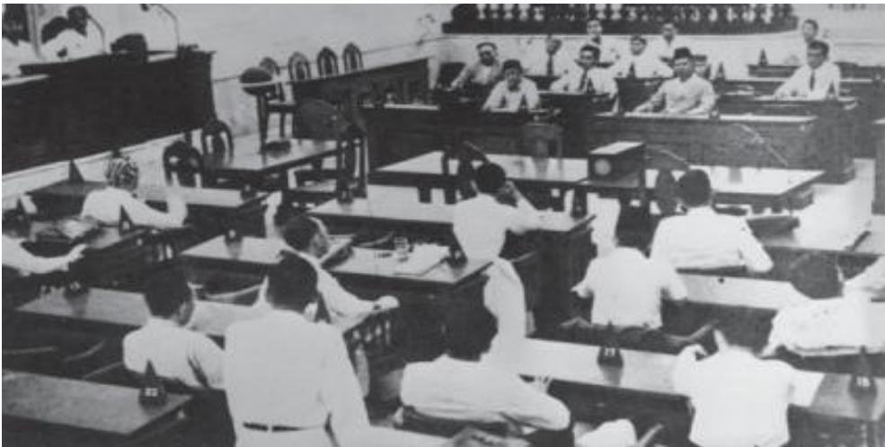
Gambar 2.0 Suasana sidang BPUPKI dalam merumuskan Pancasila sebagai dasar negara.

Pada bab ini, Anda akan dihantarkan untuk memahami arus sejarah bangsa Indonesia, terutama terkait dengan sejarah perumusan Pancasila. Hal tersebut penting untuk diketahui karena perumusan Pancasila dalam sejarah bangsa Indonesia mengalami dinamika yang kaya dan penuh tantangan. Perumusan Pancasila mulai dari sidang BPUPKI sampai pengesahan Pancasila sebagai dasar negara dalam sidang PPKI, masih mengalami tantangan berupa “amnesia sejarah” (istilah yang dipergunakan Habibie dalam pidato 1 Juni 2011).