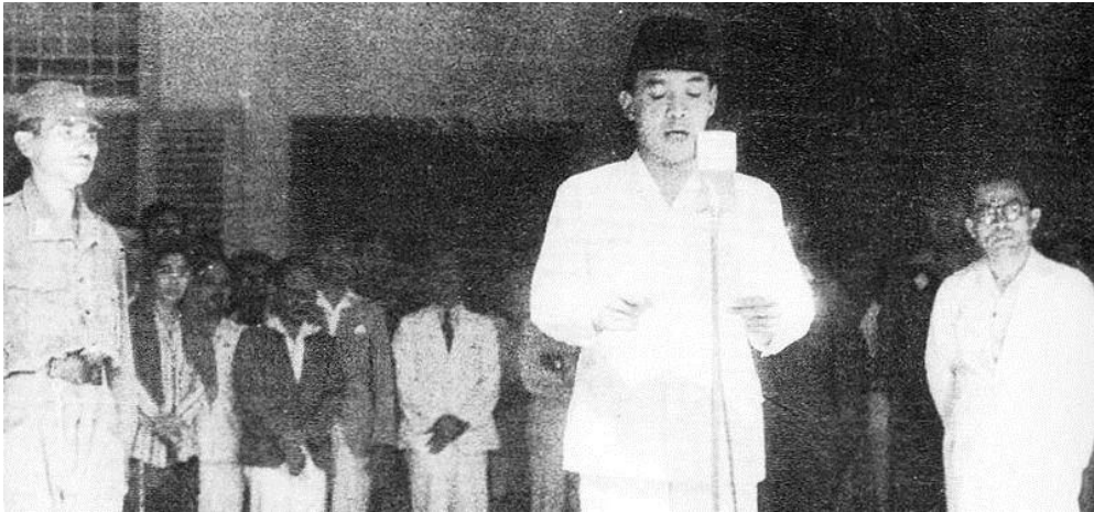
Gambar II.2: Pembacaan teks Proklamasi 17 Agustus 1945.