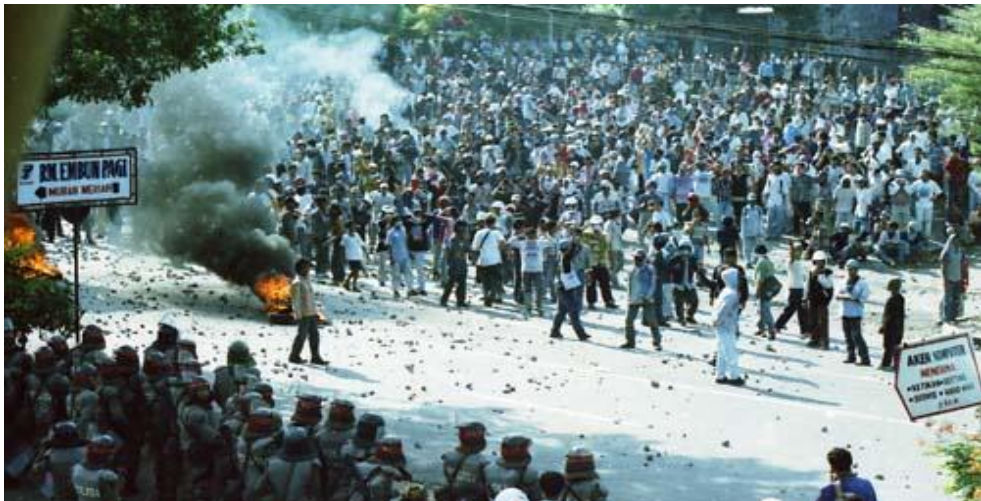
Gambar II.6: Kerusuhan Jakarta 1998, Dimana nilai-nilai Pancasila?

Anda dipersilakan untuk mendeskripsikan dan mengkritisi faktor penyebab rendahnya pemahaman dan pengamalan tentang nilai-nilai Pancasila dalam masyarakat Indonesia dewasa ini. Kemudian, mendiskusikannya dengan teman sekelompok dan melaporkannya secara tertulis.