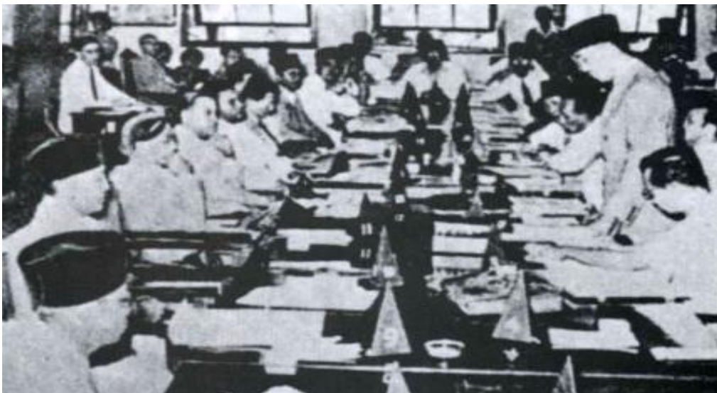
Gambar II.1: Penyampaian usulan tentang dasar negara oleh Ir. Soekarno dalam sidang BPUPKI.

Masih ingatkah Anda sejarah perumusan Pancasila yang telah dipelajari sejak di SMA/SMK/MA? Untuk membantu mengingatkan Anda, berikut ini dikemukakan beberapa peristiwa penting tentang perumusan Pancasila. Perlu Anda ketahui bahwa perumusan Pancasila itu pada awalnya dilakukan dalam sidang BPUPKI pertama yang dilaksanakan pada 29 Mei sampai dengan 1 Juni 1945. BPUPKI dibentuk oleh Pemerintah Pendudukan Jepang pada 29 April 1945 dengan jumlah anggota 60 orang. Badan ini diketuai oleh dr. Rajiman Wedyodiningrat yang didampingi oleh dua orang Ketua Muda (Wakil Ketua), yaitu Raden Panji Suroso dan Ichibangase (orang Jepang). BPUPKI dilantik oleh Letjen Kumakichi Harada, panglima tentara ke-16 Jepang di Jakarta, pada 28 Mei 1945. Sehari setelah dilantik, 29 Mei 1945, dimulailah sidang yang pertama dengan materi pokok pembicaraan calon dasar negara.