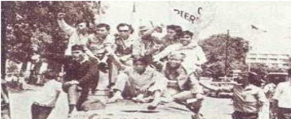
Gambar II.4: Demonstrasi Tritura oleh mahasiswa pada 1966, salah satunya menuntut penurunan harga bahan pokok

Peristiwa G30S PKI menimbulkan peralihan kekuasaan dari Soekarno ke Soeharto. Peralihan kekuasaan itu diawali dengan terbitnya Surat Perintah dari Presiden Soekarno kepada Letnan Jenderal Soeharto, yang di kemudian hari terkenal dengan nama Supersemar (Surat Perintah Sebelas Maret). Surat itu intinya berisi perintah presiden kepada Soeharto agar “mengambil langkah-langkah pengamanan untuk menyelamatkan keadaan” . Supersemar ini dibuat di Istana Bogor dan dijemput oleh Basuki Rahmat, Amir Mahmud, dan M. Yusuf.