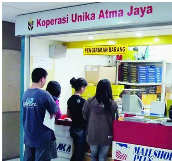
Gambar III.6: Kegiatan koperasi Mahasiswa sebagai bentuk kegotongroyongan ekonomi

terkesan mendapat perhatian yang lebih besar berdasarkan Pasal 33 ayat (1) UUD 1945. Padahal, apabila dicermati ketentuan dalam Pasal 27 ayat (2), maka terasa bahwa bentuk badan usaha milik swasta juga menempati kedudukan yang strategis dalam meningkatkan ekonomi nasional dan kesejahteraan rakyat. Di sisi lain, apabila dicermati ketentuan dalam Pasal 33 ayat (2) dan ayat (3) UUD 1945, maka Badan Usaha Milik Negara juga menempati posisi yang strategis dalam