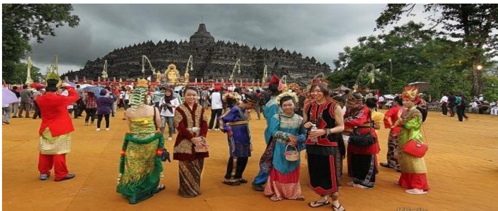
Gambar III.7: Bhinneka Tunggal Ika

Apakah Anda pernah mencoba menyapu halaman rumah dengan menggunakan satu lidi? Bagaimana kalau lidi itu banyak, kemudian diikat dalam satu ikatan? Bagaimana hasilnya, apakah cepat yang satu lidi atau seikat lidi? Pertanyaan di atas merupakan dasar berpijak masyarakat yang dibangun dengan nilai persatuan dan kesatuan. Bahkan, kemerdekaan Indonesia pun terwujud karena adanya persatuan dan kesatuan bangsa.