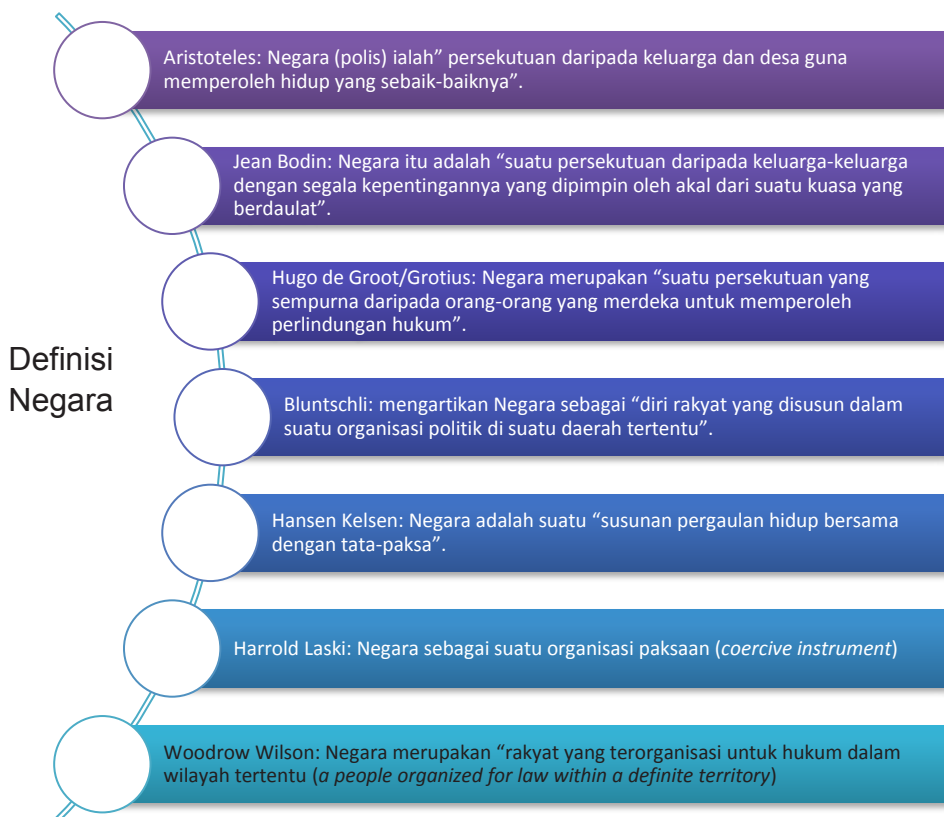
Gambar III.1: Definisi Negara oleh para ahli

Bentuk negara, sistem pemerintahan, dan tujuan negara seperti apa yang ingin diwujudkan, serta bagaimana jalan/cara mewujudkan tujuan negara tersebut, akan ditentukan oleh dasar negara yang dianut oleh negara yang bersangkutan. Dengan kata lain, dasar negara akan menentukan bentuk negara, bentuk dan sistem pemerintahan, dan tujuan negara yang ingin dicapai, serta jalan apa yang ditempuh untuk mewujudkan tujuan suatu negara.