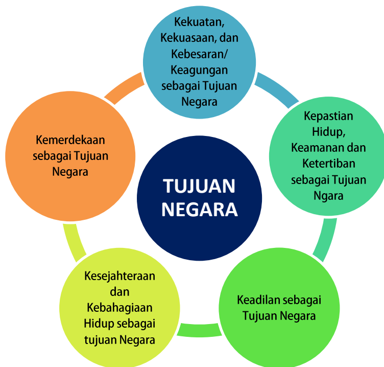
Gambar III.2: Intisari 5 teori tujuan negara

Skema di atas menggambarkan intisari 5 teori tujuan negara, yang disarikan dari Diponolo (1975: 112-156), kemudian berikut ini disajikan uraian tujuan negara dalam bentuk tabel, sebagai berikut: