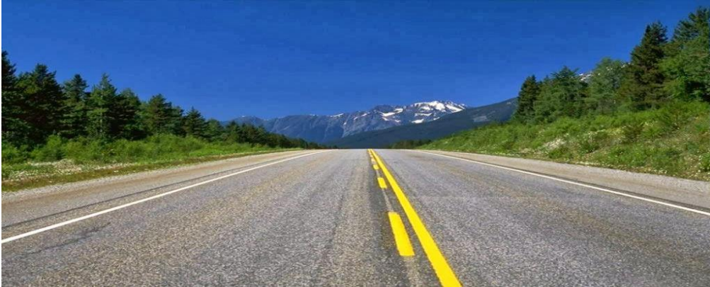
Gambar III.4: Pancasila seperti jalan aspal yang memberikan arah kemana kendaraan itu dapat dibawa tanpa ada kerusakan

Oleh karena itu, Pancasila merupakan pandangan hidup dan kepribadian bangsa yang nilai-nilainya bersifat nasional yang mendasari kebudayaan bangsa, maka nilai-nilai tersebut merupakan perwujudan dari aspirasi (cita-cita hidup bangsa) (Muzayin, 1992: 16).