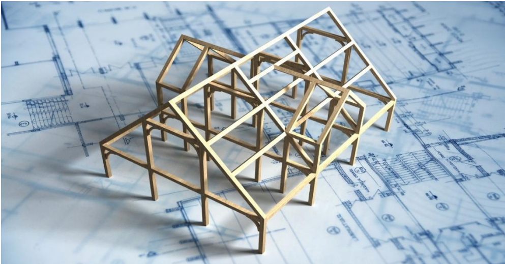
Gambar III.0 Ibarat sebuah konstruksi bangunan, Pancasila merupakan fondasi yang membuat kokoh.

Pada bab ini, Anda diajak untuk memahami konsep, hakikat, dan pentingnya Pancasila sebagai dasar negara, ideologi negara, atau dasar filsafat negara Republik Indonesia dalam kehidupan bernegara. Hal tersebut penting mengingat peraturan perundang-undangan yang mengatur organisasi negara, mekanisme penyelenggaraan negara, hubungan warga negara dengan Negara yang semua itu harus sesuai dengan nilai-nilai Pancasila.