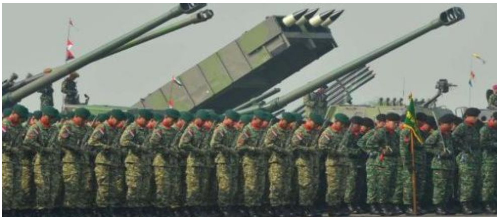
Gambar III.8: Personil tentara dan alutsista untuk mendukung strategi pertahanan dan keamanan, dibiayai dari pajak yang dibayar oleh rakyat

mewujudkan tujuan nasional. Wujud keikutsertaan warga negara dalam bela negara dalam keadaan damai banyak bentuknya, aplikasi jiwa pengabdian sesuai profesi pun termasuk bela negara. Semua profesi merupakan medan juang bagi warga negara dalam bela negara sepanjang dijiwai semangat pengabdian dengan dasar kecintaan kepada tanah air dan bangsa. Hal ini berarti pahlawan tidak hanya dapat lahir melalui perjuangan fisik dalam peperangan membela kehormatan bangsa dan negara, tetapi juga pahlawan dapat lahir dari segala kegiatan profesional warga negara. Misalnya, dalam bidang pendidikan dapat lahir pahlawan pendidikan, dalam bidang olah raga dikenal istilah pahlawan olah raga, demikian pula dalam bidang ekonomi, teknologi, kedokteran, pertanian, dan lain-lain dapat lahir pahlawan-pahlawan nasional. Demikian pula halnya dengan pembayar pajak, mereka juga pahlawan karena mereka rela menyerahkan sebagian dari penghasilan dan kekayaannya untuk membantu Negara membiayai pembangunan, seperti: pembangunan jalan/jembatan, pembayaran gaji TNI/POLRI serta penyediaan program pembangunan yang pro masyarakat miskin berupa subsidi, dan sebagainya.