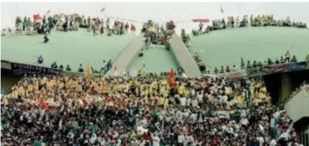
Gambar III.6: Gerakan reformasi Mei 1998 yang dilakukan oleh mahasiswa.

Pada tahun 1998 muncul gerakan reformasi yang mengakibatkan Presiden Soeharto menyatakan berhenti dari jabatan Presiden. Namun, sampai saat ini nampaknya reformasi belum membawa angin segar bagi dihayati dan diamalkannya Pancasila secara konsekuen oleh seluruh elemen bangsa. Hal ini dapat dilihat dari abainya para politisi terhadap fatsoen politik yang berdasarkan nilai-nilai Pancasila dan perilaku anarkis segelintir masyarakat yang suka memaksakan kehendak kepada pihak lain.