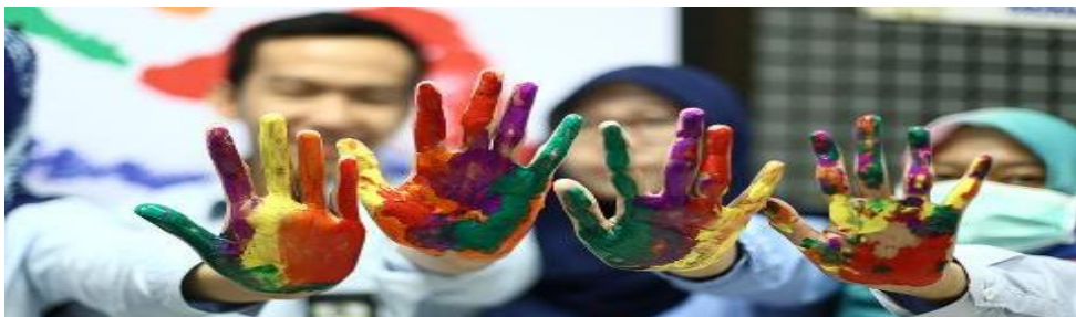
Gambar III.5: Beberapa pegawai pajak memperlihatkan tapak tangan yang telah diberi warna dalam kegiatan pembubuhan cap tapak tangan berwarna di spanduk " Pernyataan Komitmen Anti Gratifikasi No Korupsi "