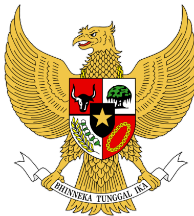
Gambar V.7: Burung Garuda Pancasila sebagai simbol Negara

Tahukah Anda apa yang dimaksudkan dengan simbol itu? Simbol menurut teori Semiotika Peirce adalah bentuk tanda yang didasarkan pada konvensi. (Berger, 2010: 247). Simbol adalah tanda yang memiliki hubungan dengan objeknya berdasarkan konvensi, kesepakatan, atau aturan. Simbol ditandai dengan kesepakatan, seperti halnya bahasa, gerak isyarat, yang untuk memahaminya harus dipelajari. Makna suatu simbol ditentukan oleh suatu persetujuan atau kesepakatan bersama, atau sudah diterima oleh umum sebagai suatu kebenaran. Contoh, lampu lalu lintas adalah simbol, yakni warna merah artinya berhenti, hijau berarti jalan, warna kuning berarti pengguna jalan harus berhati-hati. Simbol adalah sesuatu yang maknanya diterima sebagai suatu kebenaran melalui konvensi atau aturan dalam kehidupan dan kebudayaan masyarakat yang telah disepakati. Demikian pula halnya dengan Burung Garuda, diterima sebagai simbol oleh bangsa Indonesia melalui proses panjang termasuk dalam konvensi. Contoh, simbol Burung Garuda sebagai berikut: