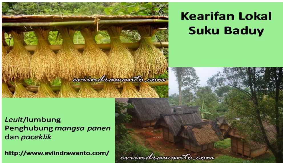
Gambar V.6: Salah satu kearifan lokal Suku Baduy adalah menyimpan padi di lumbung untuk mengatasi masa paceklik (kesusahan/kekurangan pangan)