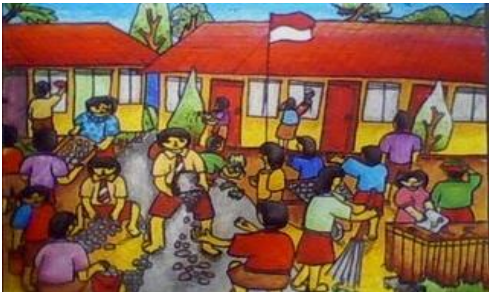
Gambar V.5: Gotong royong merupakan budaya masyarakat Indonesia. Hal ini menumbuhkan sikap sukarela, tolong-menolong, kebersamaan, dan kekeluargaan antar sesama anggota masyarakat

Landasan aksiologis Pancasila artinya nilai atau kualitas yang terkandung dalam sila-sila Pancasila. Sila pertama mengandung kualitas monoteis, spiritual, kekudusan, dan sakral. Sila kemanusiaan mengandung nilai martabat, harga diri, kebebasan, dan tanggung jawab. Sila persatuan mengandung nilai solidaritas dan kesetiakawanan. Sila keempat mengandung nilai demokrasi, musyawarah, mufakat, dan berjiwa besar. Sila keadilan mengandung nilai kepedulian dan gotong royong.