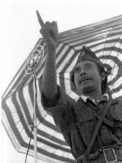
Gambar V.3: Bung Tomo, salah satu pahlawan nasional yang berhasil menggerakkan semangat rakyat melalui orasi dan pidato-pidatonya.

dalam sejarah perjuangan bangsa Indonesia. Namun, harus pula diakui bahwa para pahlawan dan tokoh-tokoh pergerakan nasional itu tidak mungkin bergerak sendiri untuk mencapai kemerdekaan bangsa Indonesia. Peristiwa Sepuluh November di Surabaya ketika terjadi pertempuran antara para pemuda, arek-arek Surabaya dan pihak sekutu membuktikan bahwa Bung Tomo berhasil menggerakkan semangat rakyat melalui orasi dan pidato-pidatonya. Dengan demikian, manusia sebagai makhluk individu baru mempunyai arti ketika berelasi dengan manusia lain sehingga sekaligus menjadi makhluk sosial.