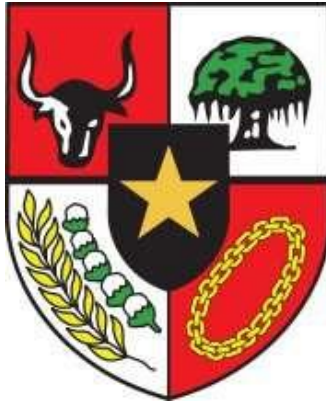
Gambar V.8: Perisai Pancasila