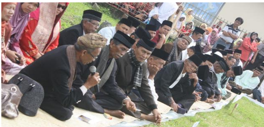
Gambar V.4: Musyawarah merupakan ciri khas masyarakat Indonesia dalam menyelesaikan masalah.

Sila Persatuan Indonesia digali dari pengalaman atas kesadaran bahwa keterpecahbelahan yang dilakukan penjajah kolonialisme Belanda melalui politik Devide et Impera menimbulkan konflik antarmasyarakat Indonesia. Sila Kerakyatan yang Dipimpin oleh Hikmat Kebijaksanaan dalam Permusyawaratan/Perwakilan digali dari budaya bangsa Indonesia yang sudah mengenal secara turun temurun pengambilan keputusan berdasarkan semangat musyawarah untuk mufakat. Misalnya, masyarakat Minangkabau mengenal peribahasa yang berbunyi " Bulek aie dek pambuluh, bulek kato dek mufakat ", bulat air di dalam bambu, bulat kata dalam permufakatan. Sila Keadilan Sosial bagi Seluruh Rakyat Indonesia digali dari prinsip-prinsip yang berkembang dalam masyarakat Indonesia yang tercermin dalam sikap gotong royong.