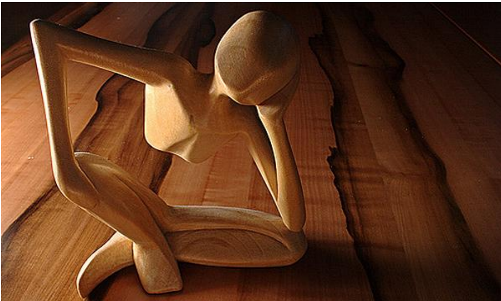
Gambar V.0 Perenungan merupakan upaya untuk menemukan nilai-nilai filosofis yang menjadi identitas.

Pancasila sebagai sistem filsafat merupakan bahan renungan yang menggugah kesadaran para pendiri negara, termasuk Soekarno ketika menggagas ide Philosophische Grondslag . Perenungan ini mengalir ke arah upaya untuk menemukan nilai-nilai filosofis yang menjadi identitas bangsa Indonesia. Perenungan yang berkembang dalam diskusi-diskusi sejak sidang BPUPKI sampai ke pengesahan Pancasila oleh PPKI, termasuk salah satu momentum untuk menemukan Pancasila sebagai sistem filsafat.